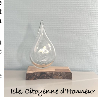
Isle, Citoyenne d'Honneur