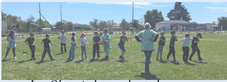
Les Olympiades sur le stade