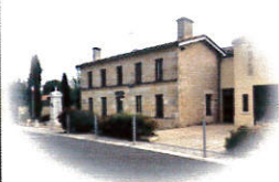
La Maison pour Tous Point lecture/cyber 625 rue de Verdun

La mairie est fermée au public le mardi et vendredi matin Contact : téléphone : 05 57 49 62 19 / Télécopie : 05 57 69 00 16 mairie@stantoinessurlisle.fr —site internet : www.stantoinessurlisle.fr Madame PEYRIDIEUX, Maire, reçoit sur rendez-vous