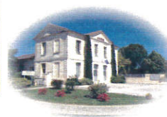
Mairie 648 rue de Verdun