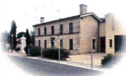
La Maison pour Tous Point lecture/cyber