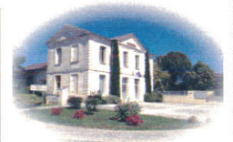
Mairie 648 rue de Verdun