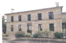
La Maison pour Tous Point lecture/cyber 625 rue de Verdun

LUNDI de 8 h 30 à 12 h 30- 14 h à 18 h / MARDI de 14 h à 18 h JEUDI de 8 h 30 à 12 h - 13 h 30 à 18 h / VENDREDI de 14 h à 17 h SAMEDI de 9 h à 12 h