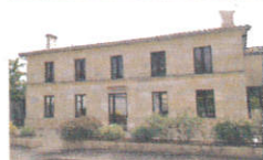
La Maison pour Tous