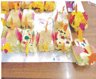
Poules créées pour Pâques