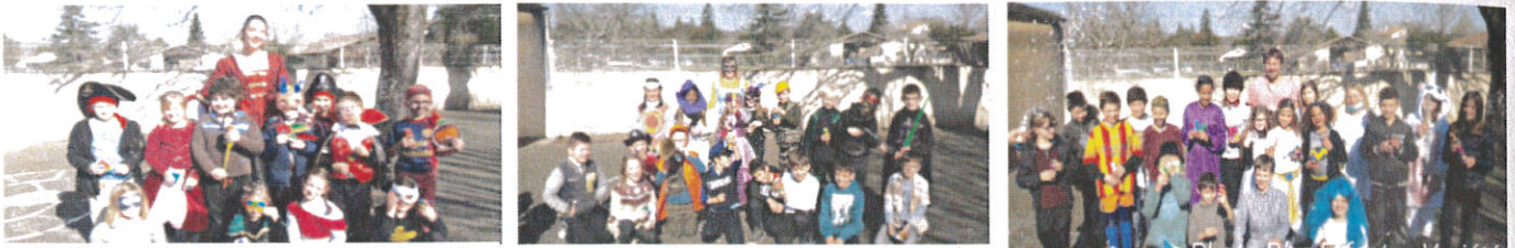
Voici quelques créations des activités périscolaires