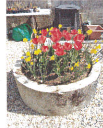
Jardin potager et plantations faites par les enfants

Nous tenons à remercier tous les bénévoles et parents pour leurs participations et vous informons que la kermesse se déroulera le vendredi 30 juin prochain.