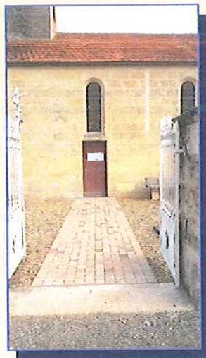
Mise en accessibilité de l'église.