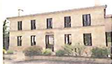
La Maison pour Tous

Contacts : 648 rue de Verdun 33660 SAINT ANTOINE SUR L'ISLE Téléphone : 05 57 49 62 19 / Télécopie : 05 57 69 00 16 mairie@stantoinessurlisle.fr