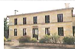
La Maison pour Tous

Tous les jours pendant les heures d'ouverture de la mairie.